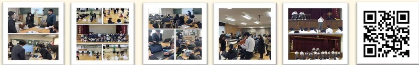
大東高校ホームページQR

ここでは“伝え切れない大東高校の魅力”をHPなどでアップしていますので、是非ご覧ください!!