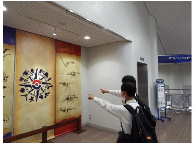
<三瓶自然館サヒメルにて>