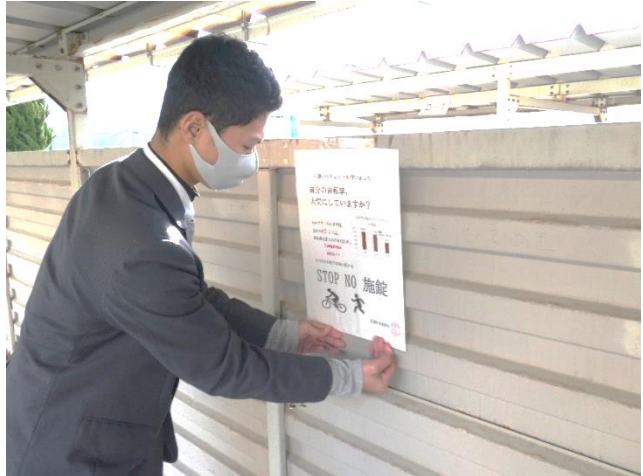
<ポスター掲示の様子>