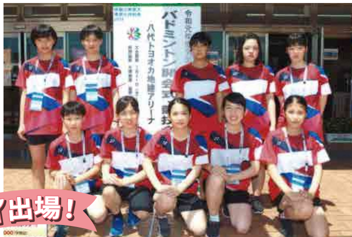
バドミントン部女子学校対抗・男子ダブルス