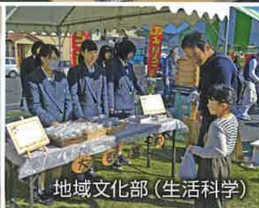
地域文化部(生活科学)