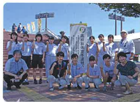
応援をいただきましたたくさんの皆様、本当にありがとうございました。