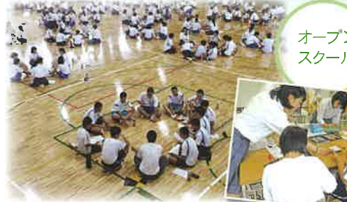
オープン スクール