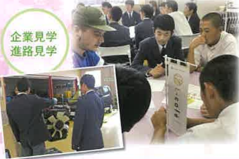
企業見学 進路見学