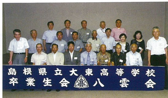
広島支部会参加者記念撮影