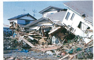
沿岸部：寺島地区の被災状況 (H23.3)

忘れかけていませんか？ あの東日本大震災 大津波により、多くの尊い命が奪われたことを 家族や住む家を失った多くの人々が、 今なお仮設住宅で不自由な生活を強いられていることを