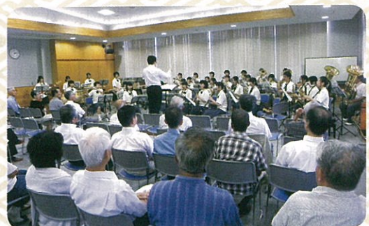
吹奏楽部による演奏