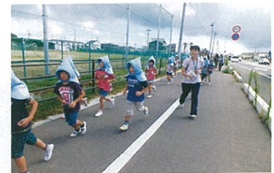
津波を想定した避難訓練 (H24.9)

との声を耳にしました。島根に帰ってから一番驚いたのは、震災関連の情報に接する機会があまりにも少ないということでした。3月末まではテレビや新聞で毎日のように震災関連ニュースを見聞きしていましたが、帰った途端に情報が途切れ、普段の会話の中で被災地の話題を口にするのがほとんどなく、残念な気がしてなりません。あんなに身近だった東日本大震災が、島根にいるとはるか遠くに感じてしまい、震災の話題がどこからも聞かえてこない現実に、今でも戸惑っています。それでもあえて言いたいのは、被災地では今でも夕方のトップニュースは震災復興に関するものであり、二年半経った今でも多くの被災者が変わらず大変な思いをしながら生活している、復興はまだまだ進んでいないということです。そして、それらのことを私たちは決して忘れてはいけないと思うのです。