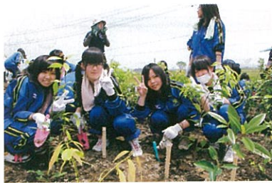
「千年希望の丘」植樹祭 (H24.5)

岩沼市が策定した震災復興計画の中に、避難場所と多重防御の機能を有した「津波よけ『千年希望の丘』の創造」があります。千年希望の丘は、震災瓦礫などを活用して作ったいくつもの丘（盛土）によって津波の力を減衰させるもので、昨年5月に開催された植樹祭には、市民ら約1,000人が参加してタブノキやシラカシなど約20種の苗木6,000本を植えました。運営補助として参加した私ですが、大人に混じって高校生や小さな子供たちまでもが真剣に植樹する姿に感動、復興へと歩きだした小さな足音が、これから更に大きく力強くなっていくことを切に願う一日となりました。