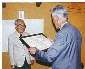
奥田前関東支部長へ感謝状贈呈