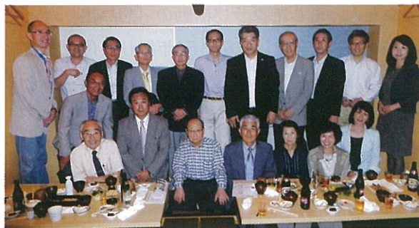
関東支部会参加者記念撮影

6月8日の関東支部会では、私たち同期の方々も初参加で出席して頂きましたが、やはり同期の人がいることで出席しようと思われる方も多いと感じました。今後は、幅広い年代の方に出席頂けるよう、知恵を絞っていきたいと思います。大東高校の関係者の方、関東エリアだけに及ばず、全国の八雲会の方の協力を賜りやっていきたいと思っておりますので、宜しくお願い致します。