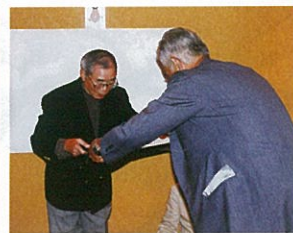
野々村前事務局長へ感謝状贈呈