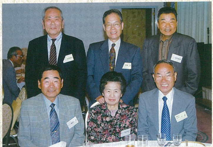
昨年10月関西支部会にて 前列左が筆者

学校運営組織で、生徒会が主体としている、体育部門会と文化部門会に所属する部活動のご説明をいただき、実際に校内を見学しました。活動拠点である部屋（教室）では、整理整頓が行き届いており、用具や備品が整然と保管・管理されており感心させられました。この恵まれた教育環境の下、生徒たちは、勉強と部活動に励み、素晴らしい成績を残している、その努力にエールを送ります。また、各クラブが、地域への社会貢献を積極的に行っていることは、とても貴重なことだと感じました。