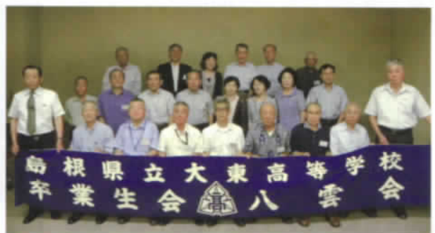
〈広島支部会参加者記念撮影〉