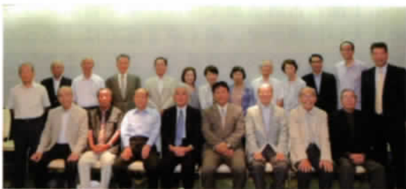
〈関東支部会参加者記念撮影〉

首都圏在住の雲南市出身者でつくる「雲南市東京ふるさと会」の方々がこの5月に福島県石川町を