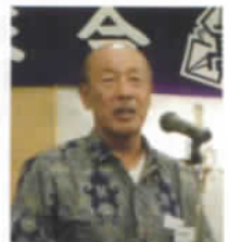
〈富久広島支部長ご挨拶〉

懇親会では、大東高校の現在の様子などを紹介するスライドを映しましたが、その中に参加者の方々の懐かしいスライドもあり盛り上がっていました。最後は参加者お一人お一人の近況報告があり、来年の再会を約して中締めをしました。また、ほとんどの方が同ホテルの地下のスナックでカラオケを歌われ、自慢のものを披露され、賑やかで和やかな雰囲気の中で支部会が終わりました。