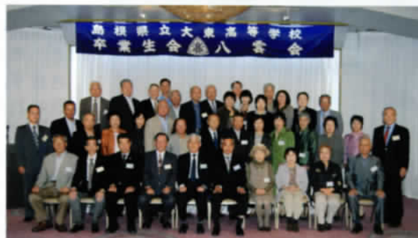
昨年の関西支部会

それはともかく、アンケートの「今後の会合等の案内はしてほしい」と回答した195名を対象として名簿を作成し、関西支部の会員として対応している。その後、入会者もあり現在200名の会員。関西在住の方で、そんな案内は来ていない、と不審に思っている方は、案内文書を新たに出します。右記の連絡先に一報ください。